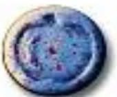
Apple 9.2 x 5.1 mm 62 mg MDMA trace caffeine