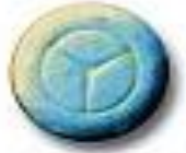
Mercedes 6.8 x 5.2 mm 11 mg amphetamine + trace caffeine