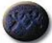
Twins 9.2 x 4.1 mm 79 mg MDMA