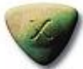
Triangle 18.2 x 4.7 mm 38 mg MDMA