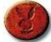
Red Playboy 8.3 x 3.2 mm 17 mg amphetamine + trace caffeine