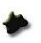
Micro 3.8 x 1.7 mm LSD