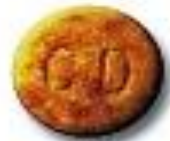
CD 8.1 x 4.0 mm 9 mg amphetamine + trace caffeine