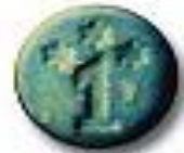
Number One 8.2 x 4.8 mm 54 mg MDMA