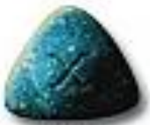
Triangle 10.1 x 4.2 mm 107 mg MDMA