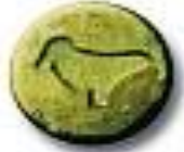
Dove 9.2 x 5.8 mm 67 mg MDMA + 31 mg MDMA