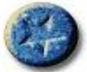
Blue Star 8.7 x 5.4 mm 11 mg amphetamine + trace caffeine