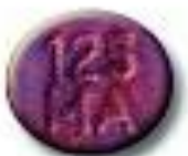
One Two Flea 9.1 x 7.4 mm 47 mg MDMA