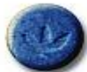
Adidas 8.7 x 5.1 mm 25 mg amphetamine + trace caffeine