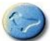
Dove 9.1 x 3.0 mm 18 mg amphetamine + trace caffeine