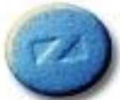
Pyramid 10.1 x 4.5 mm medicine called Neo-Cibaige