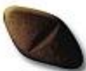
Diamond 11.7 x 7.3 mm x 4.3 mm 181 mg MDMA