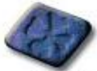
Clover Leaf 7 x 6 x 4.8 mm 40 mg MDMA + 19 mg MDMA