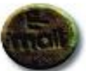
E-mail 4.1 x 2.5 mm 71 mg MDMA