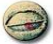
Lips 8.1 x 5.4 mm 61 mg MDMA