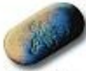
Thunderbolt 7.8 x 5.2 mm 50 mg MDMA