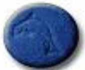
Delphin 9.2 x 2.6 mm 25 mg MDMA + 5 mg MDMA