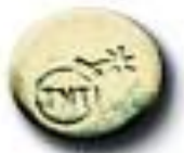
TNT 16.1 x 3.4 mm 55 mg MDMA