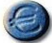
Euro 9.2 x 2.8 mm 37 mg MDMA