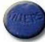
Kickers 8.1 x 4.5 mm 130 mg MDMA + caffeine