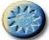
Sunrise 9.1 x 4.6 mm 120 mg MDMA